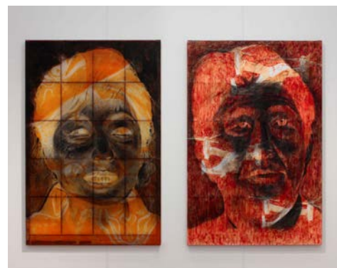
「辣尼-ケチャップ野郎」1372×874×30mm×2枚 障子・鳥の子紙・辣油・ケチャップ・木炭、2015年