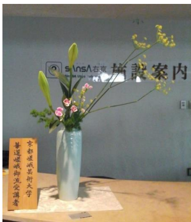
挿花者：大宮 拓真 右京区役所