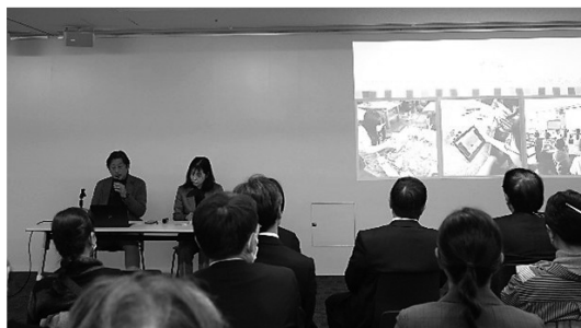
フォーラムでの発表の様子(西京極西小学校・中下校長先生と共に)