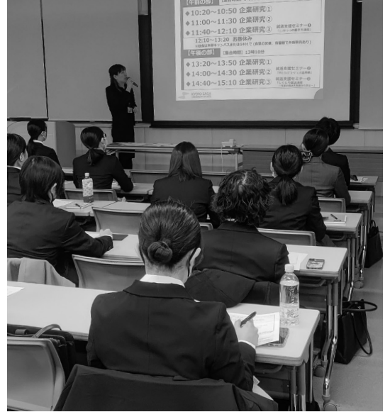
森原キャンパスでの「業界・企業研究会」の様子