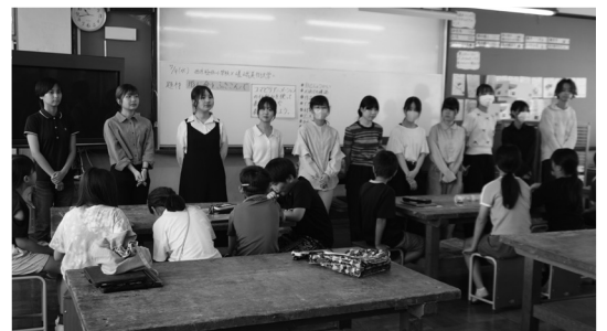
児童の前で自己紹介する学生たち